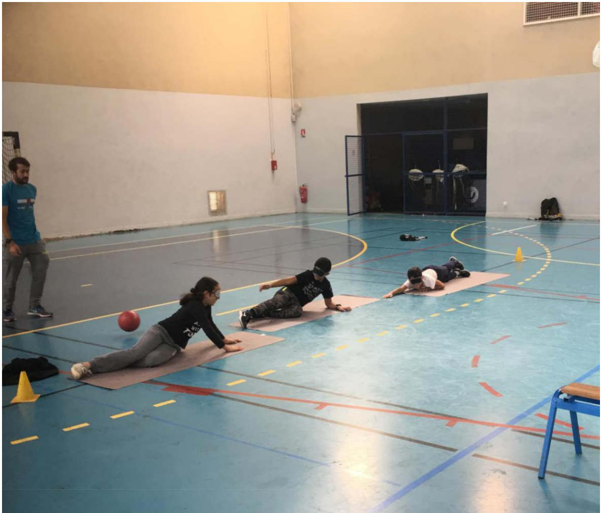
Atelier torball avec un groupe d'élèves de 5ème – lors de la journée d'animation pédagogique au Collège Beau Soleil à Chelles (77).