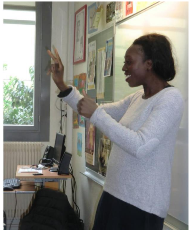
Atelier langue des signes avec un groupe d'élèves de 5ème – lors de la journée d'animation pédagogique au Collège Guillaume Apollinaire à Paris (75).