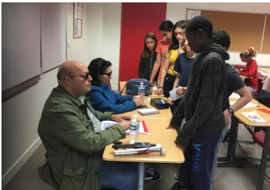
Atelier braille pour un groupe d'élèves de 5 ème , au collège Beau Soleil à Chelles (77).

L'atelier démarre par la projection d'un court-métrage de 9 minutes qui présente des enfants porteurs de handicaps différents «Un autre regard sur le handicap» , le dialogue s'amorce et l'atelier peut démarrer. Si la première question est toujours difficile pour un jeune devant ses copains, les suivantes fusent et s'enchaînent. L'intérêt des jeunes s'accroît au fur et à mesure de l'avancement de la rencontre et les émotions s'intensifient.