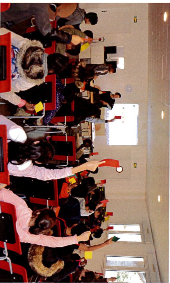
► Les élèves du collège Robespierre ont mesuré leur confiance au sein de leur école.